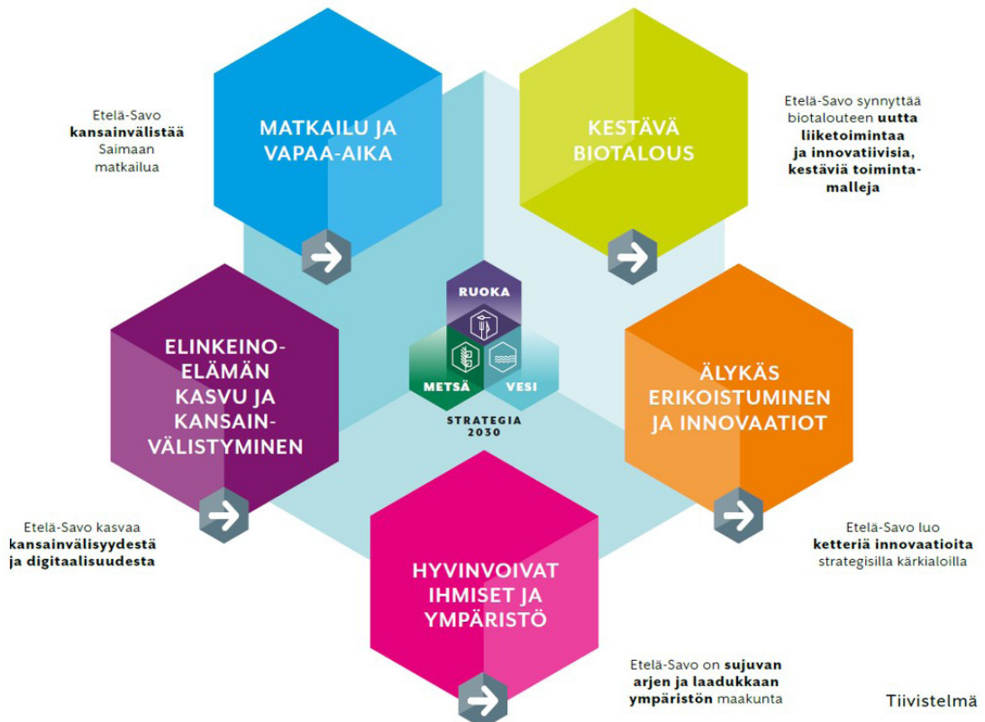
ETELÄ-SAVON MAAKUNTAOHJELMAN TEEMAT JA TAVOITTEET

Maakuntavaltuusto hyväksyi marraskuussa 2017 Etelä-Savon maakuntaohjelman vuosille 2018–2021. Kokonaisumaakuntakaavan valtuusto hyväksyi jo syysvaltuustossa 2016. Maakuntaohjelma ja maakuntakaava perustuvat vuoden 2016 lopussa valmistuneen maakuntastrategian kolmelle kärjelle, jotka ovat metsä, ruoka ja vesi. Maakuntaohjelman tavoitteet ja toimenpiteet edistävät ihmisten hyvinvointia, elinkeinoelämän kasvua ja kansainvälistymistä, matkailua, biotalouden tuotantoa sekä älykästä erikoistumista.